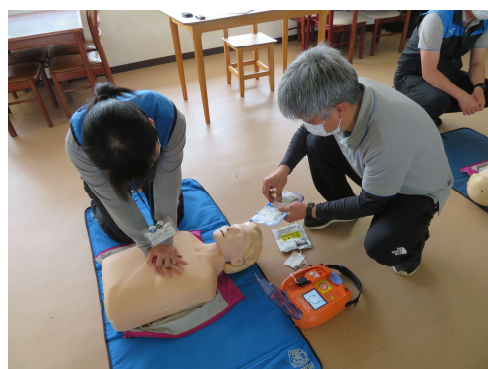
美女平駅 救急救命訓練（AED取扱訓練）

事故災害時に迅速な対応ができるよう、運行障害や火災の発生を想定した救助訓練や避難訓練を実施しています。また、当社施設が山岳地帯にあり、病院への搬送に時間がかかるという地理的的特殊性も踏まえ、救急救命講習の受講やAEDの全駅配備等により、急病人に的確な対処ができるよう備えています。