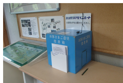
お客さまご意見投書箱【立山駅】

お寄せいただいたご意見・ご要望は毎月取りまとめ、社内組織である「お客様の声委員会」を通じて全社で情報を共有し、より一層のサービス向上の参考とさせていただきます。