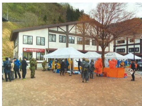
関係機関合同での緊急事態対処訓練（立山駅）