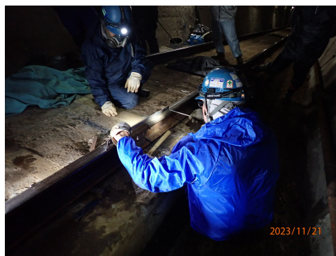
黒部ケーブルカー線 レール部分取替工事

令和5年度は、立山ケーブルカー線の落石対策工事及び黒部ケーブルカー線のレール部分取替工事を実施し、美女平給油所においては給油計量器2台を更新いたしました。