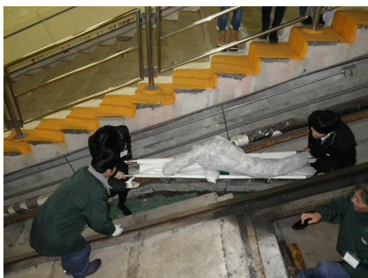
黒部ケーブルカー 傷病人搬送訓練

事故災害時に迅速な対応ができるよう、運行障害や火災の発生を想定した救助訓練や避難訓練を実施しています。また、当社施設が山岳地帯にあり、病院への搬送に時間がかかるという地理的特殊性も踏まえ、救急救命講習の受講やAEDの全駅配備等により、急病人に的確な対処ができるよう備えています。