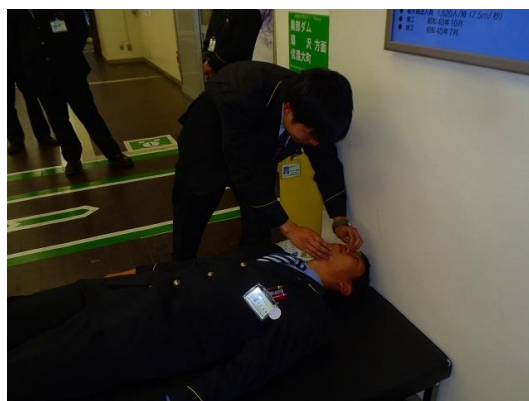
大観峰運輸区 救急救命訓練