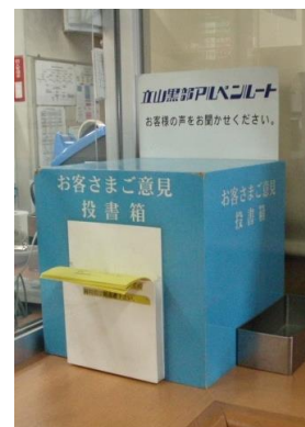
お客さまご意見投書箱(室堂)

お寄せいただいたご意見・ご要望は毎月取りまとめ、社内組織である「お客様の声委員会」を通じて全社で情報を共有し、より一層のサービス向上の参考とさせていただきます。