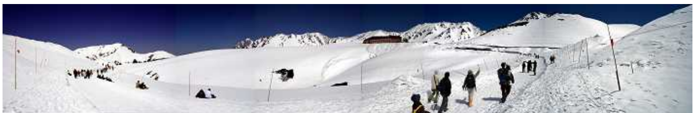
ハノラマロードよりホテル立山を望む