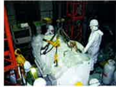
主電動機据付作業の様子

主電動機（メインモーター）を取り替えました。本体重量は約3トンになります。併せて黒部平滑車軸受取り替えなど4件の工事も実施しました。