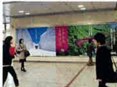
JR名古屋駅 エクスプレスボード (22年4月)