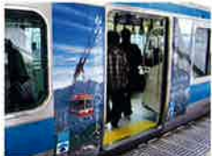
首都圏 京浜東北線 車体広告 (22年3月～4月)

当社では、21年春季～夏季にあわせ、富山県や関係諸団体との連携のもと、首都圏、東海圏、関西圏の三大都市圏で、大型宣伝事業を展開しました。首都圏では山手線車体広告、東海圏ではJR名古屋駅懸垂幕、関西圏ではJR京都線・神戸線でのWESTビジョン（社内モニター広告）などです。なお、22年春季も、アルペンルート営業再開にあわせ、京浜東北線車体広告などを実施しており、今後、夏季、秋季にも実施を計画しています。（下写真は22年春実施の様子）