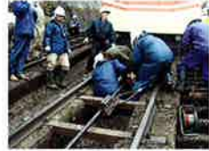
ロープ取り替え作業の様子