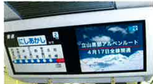
JR京都線・神戸線ほか WESTビジョン（車内モニター映像） (22年4月)